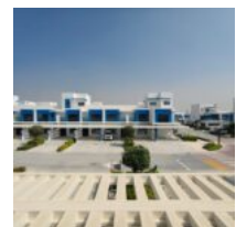
DAMAC lagoons Santorini 1 Cluster

Ubicado en la prestigiosa comunidad de Damac Lagoons, este sofisticado Townhouse amueblado de 4 dormitorios en el clúster Santorini 1 destaca por su amplitud de 2227.27 SQFT de construcción sobre un terreno de 1550 SQFT. La propiedad, lista para mudanza inmediata (Ready To Move in), se posiciona en una ubicación privilegiada de fila única (Single [...])